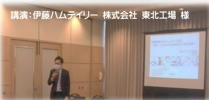
講演: 伊藤ハムテイリー 株式会社 東北工場 様