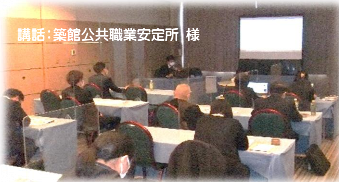
講話: 築館公共職業安定所 様

今後も障害者雇用の啓発に向けた研修会等、皆さまからのご意見等を伺い、企画して参ります。